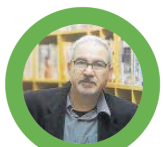
Andreu Carranza Escritor

Acaba de presentar su última novela, 'Ciutat de Llops', que sumerge a los lectores en un río Ebre que esconde un sinfín de misterios. Según explica el autor, natural de Ascó, «he hecho una catarsis, un viaje a mí mismo dentro de mis obsesiones como escritor».